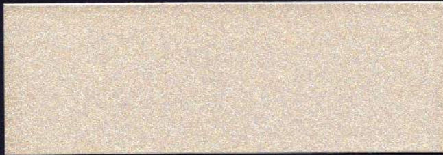
PLATA ÁRTICO MT-01 ARGENT ARCTIQUE MT-01 ARCTIC SILVER MT-01