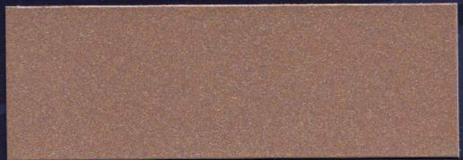
MOCCA MT-21 MOCCA MT-21 MOCCA MT-21