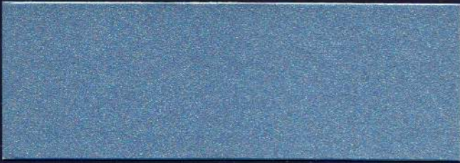
BAHÍA MT-16 BAIE MT-16 BAY MT-16