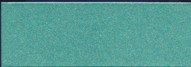
TURQUESA MT-24 TURQUOISE MT-24 TURQUOISE MT-24