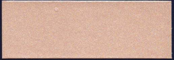
PANAMÁ MT-17 PANAMA MT-17 PANAMA MT-17