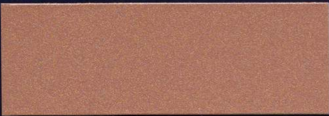
BIZANCIO MT-18 BYZANCE MT-18 BYZANTIUM MT-18