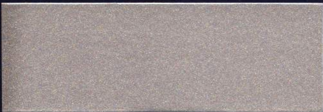
PLATA VIEJA MT-08 ARGENT VIEILLI MT-08 OLD SILVER MT-08