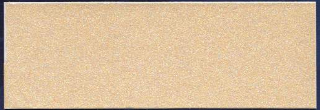
CREMA MT-25 CRÈME MT-25 CREAM MT-25