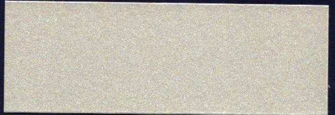
VERDE CLARO MT-05 VERT CLAIR MT-05 LIGHT GREEN MT-05