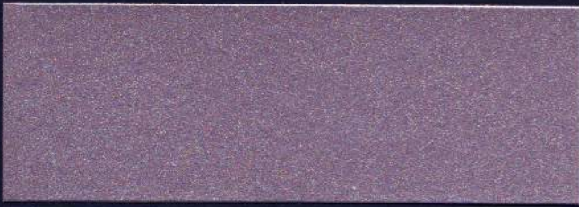
PÚRPURA MT-14 POURPRE MT-14 PURPLE MT-14