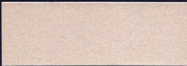
PÉTALO MT-20 PÉTALE MT-20 PETAL MT-20