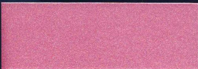
PINK MT-12 ROSE MT-12 PINK MT-12