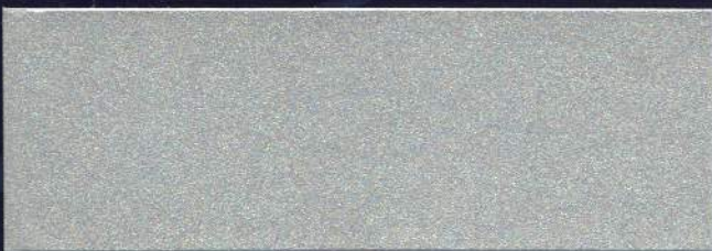
BOREAL MT-22 BORÉAL MT-22 BOREAL MT-22