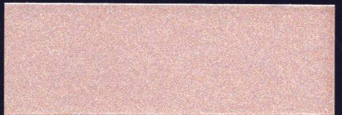
ROSA PALO MT-09 ROSE PÂLE MT-09 PALE PINK MT-09