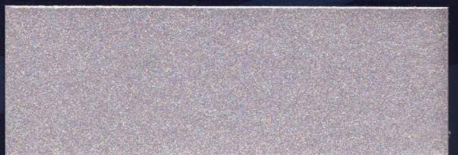
LILA MT-13 LILAS MT-13 LILAC MT-13