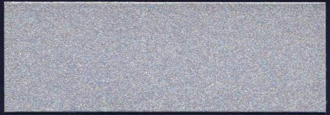
AZUL PERLA MT-15 BLEU PERLE MT-15 PEARL BLUE MT-15