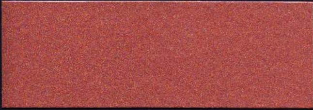
COBRE MT-04 CUIVRE MT-04 COPPER MT-04