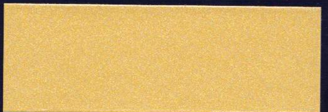
HINDÚ MT-07 HINDOU MT-07 HINDU MT-07