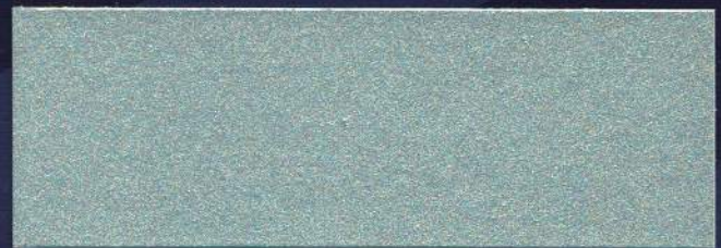
HORIZONTE MT-23 HORIZON MT-23 HORIZON MT-23