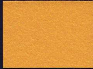
ORO MT-02 OR MT-02 GOLD MT-02