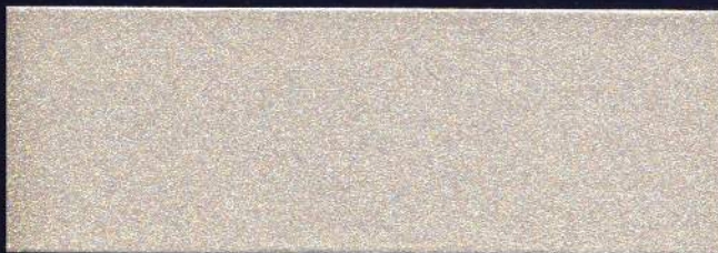
BEIGE MT-06 BEIGE MT-06 BEIGE MT-06