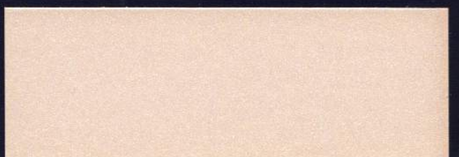
DELICIA MT-11 DÉLICE MT-11 DELIGHT MT-11