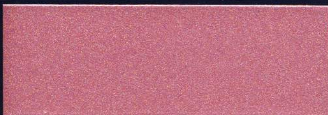
ROSA CARMÍN MT-10 ROSE CARMIN MT-10 CARMINE PINK MT-10